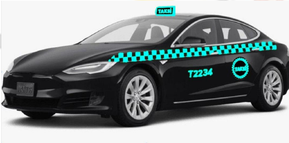
Şekil 6: İhale metodu ile kiralanan "D" segment üstü siyah renkli taksi