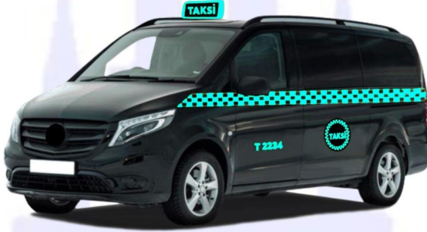
Şekil 5: İhale metodu ile kiralanan 8+1 koltuk kapasiteli siyah renkli taksi