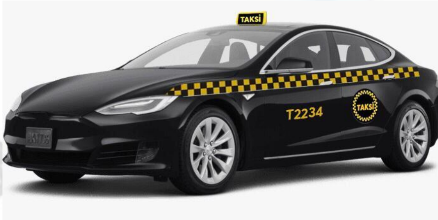
Şekil 4: "D" segment üstü siyah renkli taksi