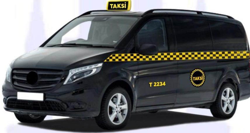
Şekil 3: 8+1 koltuk kapasiteli siyah renkli taksi