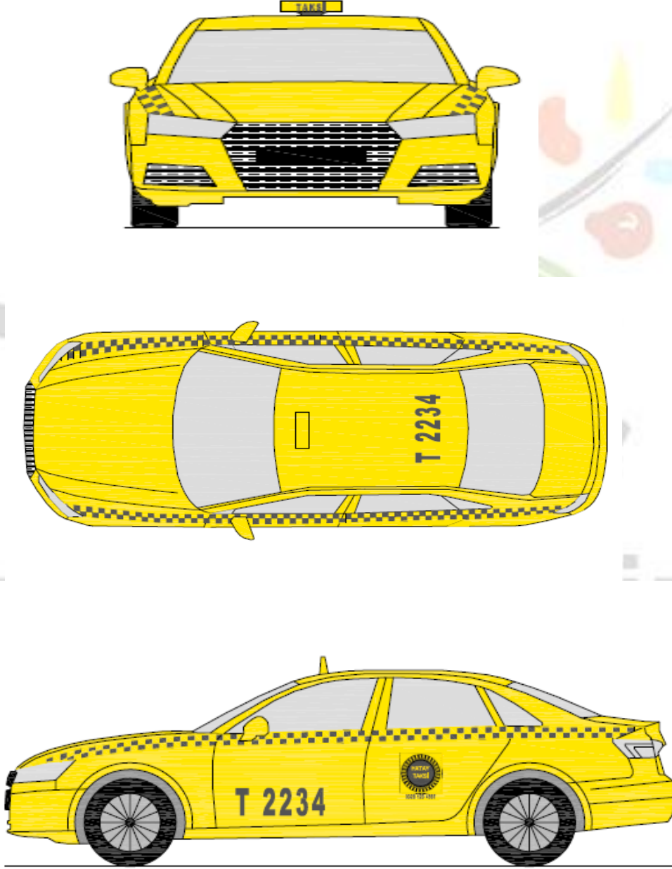
Şekil 1: Normal sarı renkli taksi (Mevcut taksi duraklarında faaliyet gösteren)