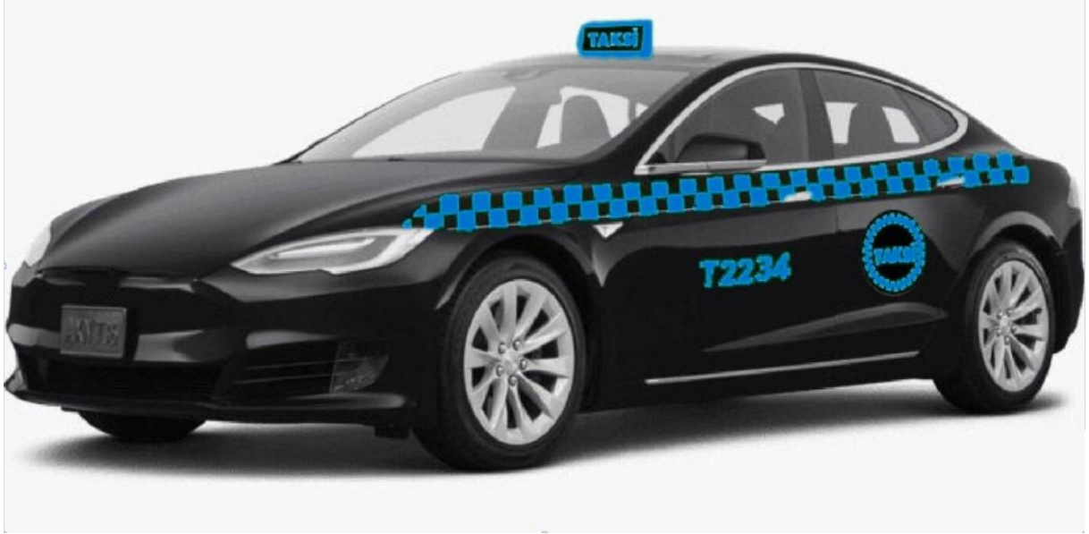
Şekil 6: İhale metodu ile kiralanan “D” segment üstü siyah renkli taksi