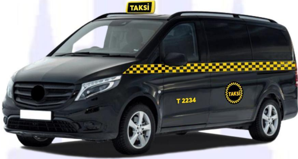
Şekil 3: 8+1 koltuk kapasiteli siyah renkli taksi