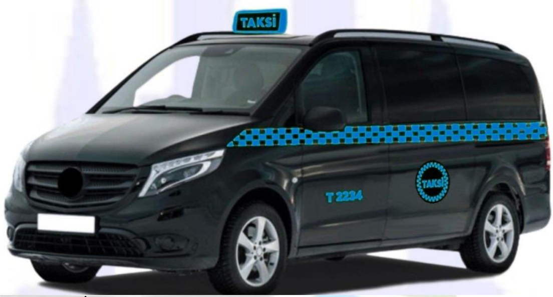
Şekil 5: İhale metodu ile kiralanan 8+1 koltuk kapasiteli siyah renkli taksi